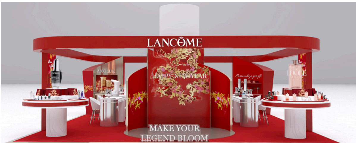
Lancôme Pop-Up (3D)