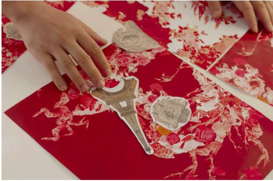
Jacky Tsai work in progress