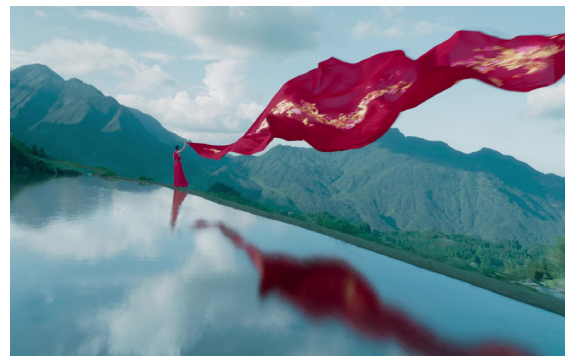
Ni Ni (Hero Movie)

« La nouvelle année est synonyme d'adieu à l'ancien et d'accueil du nouveau. Le dragon est également mon signe astrologique, et j'espère que cette année sera plus douce. Je souhaite à toutes une année fabuleuse, que tous vos rêves se réalisent » déclare Ni Ni ambassadrice Lancôme