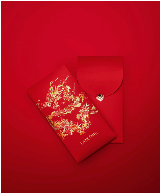
Enveloppe rouge Lancôme