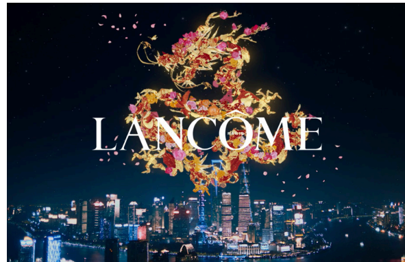
Lancôme Loong dans le ciel de Shanghai