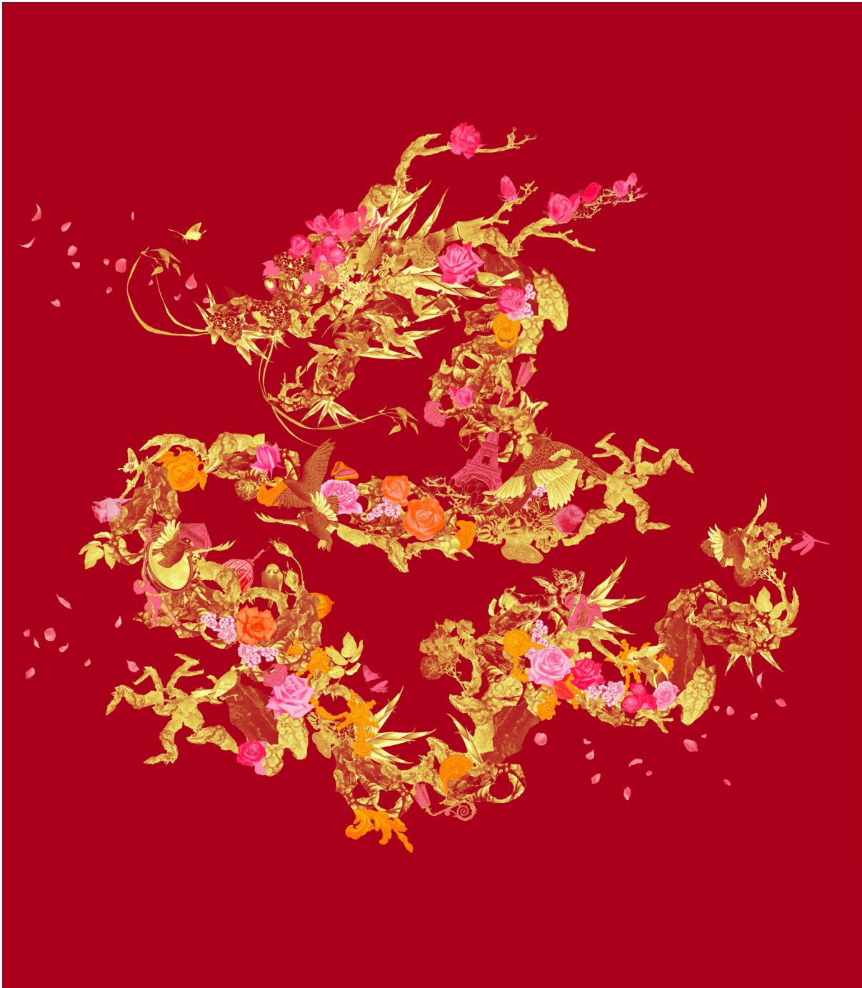
Dragon Lancôme par Jacky Tsai