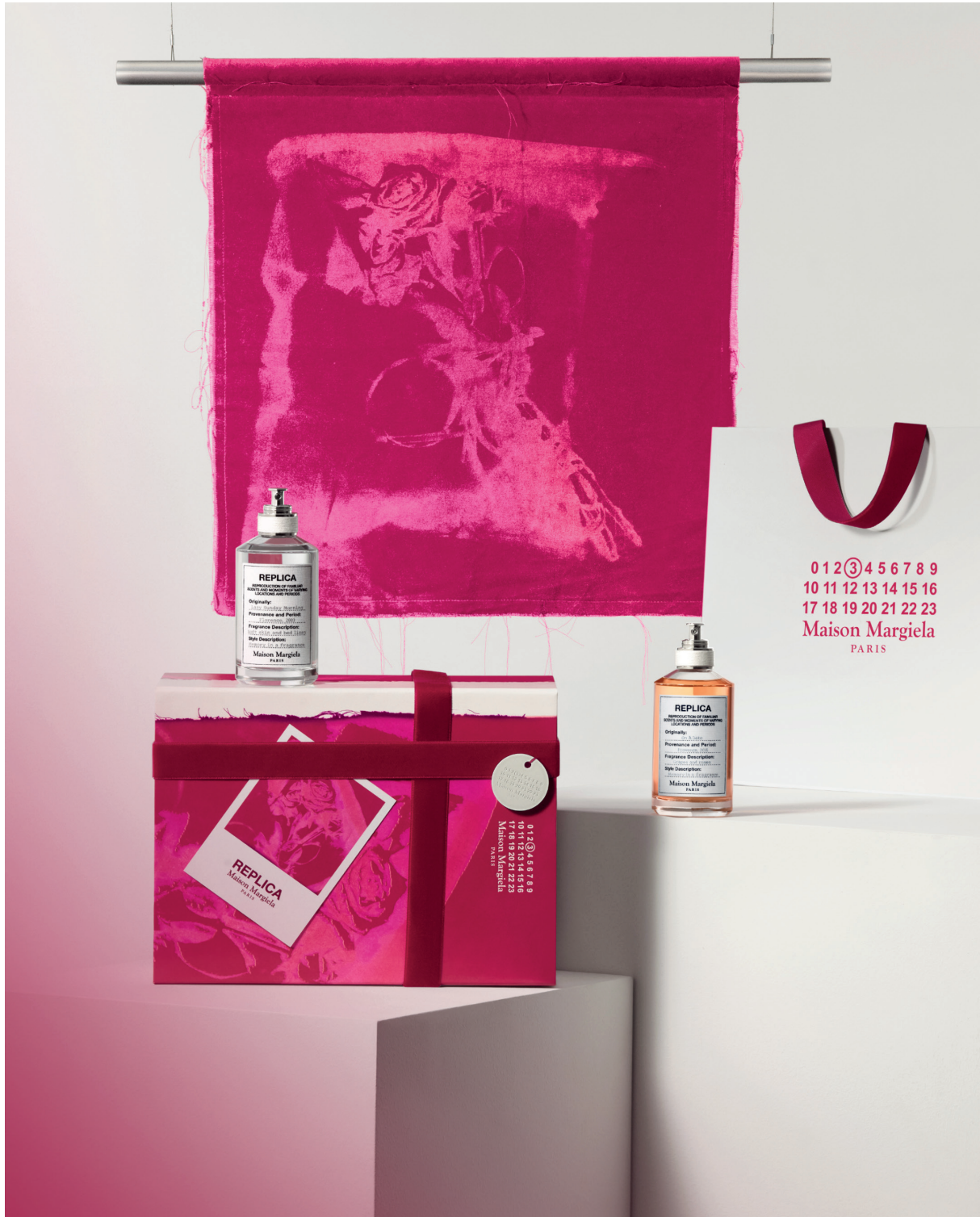
Oeuvre de Duoduo Huang