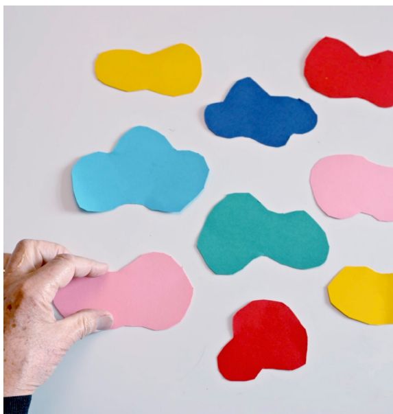
Portrait de l'artiste