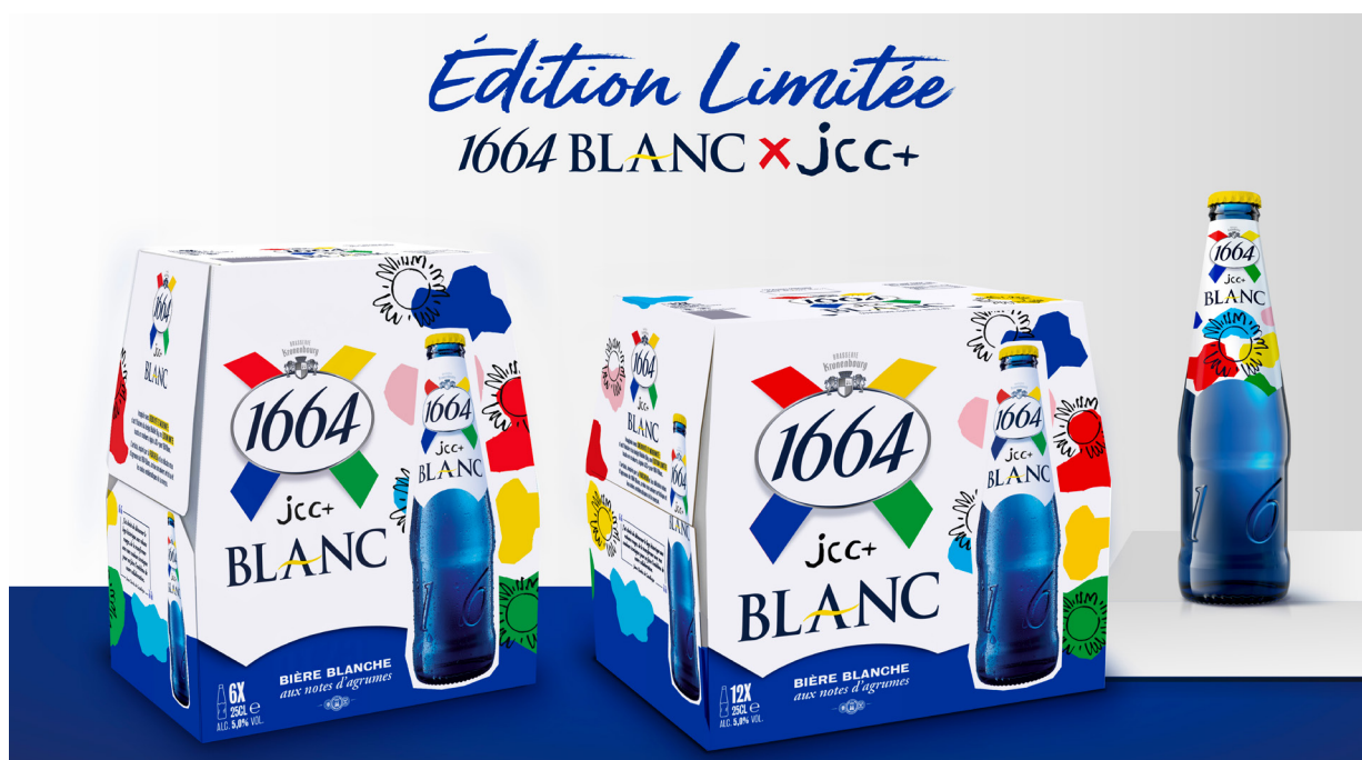
1664 BLANC X Jean-Charles de Castelbajac