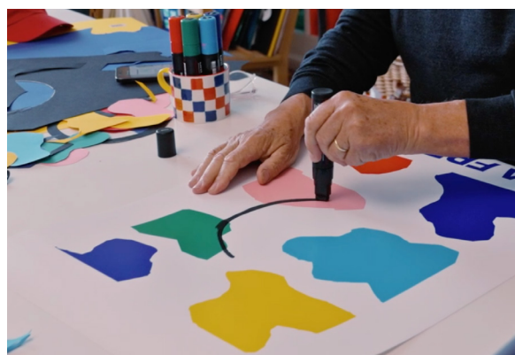
1664 BLANC X Jean-Charles de Castelbajac

1664 BLANC et Jean-Charles de Castelbajac ont dévoilé leur collaboration lors d'une soirée inédite en plein cœur du Marais à Paris. Cet événement est une occasion supplémentaire pour la marque de réaffirmer son engagement artistique en mettant en avant sa dernière collaboration et en présentant une performance inédite en live de Castelbajac, une prestation de Eloi jeune artiste montante de la scène musicale française ainsi qu'une ambiance musicale du DJ Benjamin Belin.