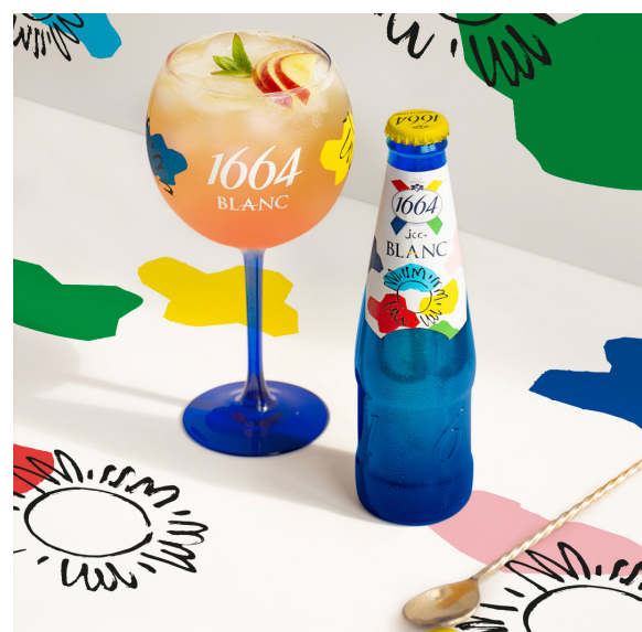
1664 BLANC X Jean-Charles de Castelbajac cocktail

« Mon objectif a été de transformer cette bouteille historique en un objet iconique. C'est ainsi que l'idée d'un ciel multicolore s'est imposée à moi. » JCC